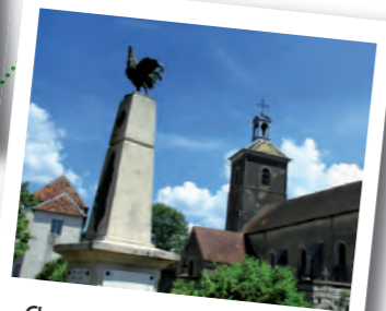
Chenevrey et Morogne